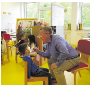
Dann wurden die Zähne der Kinder untersucht

Dr. Eberhard hat uns erst einmal alle begrüßt. Die Kinder waren ganz schön aufgeregt. Er hatte den Simon dabei. Einen Jungen aus Karton. Gemeinsam mit Dr. Eberhard haben die Kinder überlegt welche Lebensmittel gesund sind und welche eher ungesund. Simon durfte dann ganz schön viel naschen.