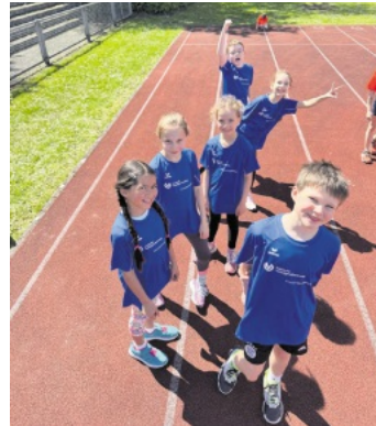
Hausemer Flitzer – 1

die sich für die Sportart interessieren, sind zum Schnuppern willkommen.