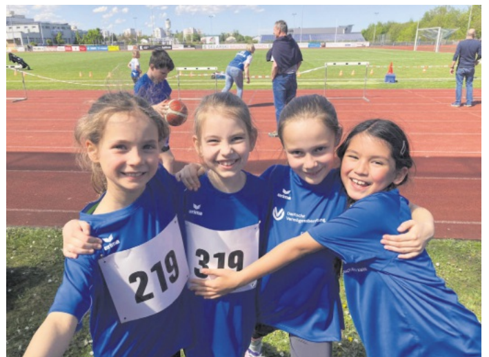
Hausemer Flitzer – 2

Vergangenen Samstag traten wir zum zweiten Mal mit den „Hausemer Hüpfen“ an und die „Hausemer Flitzer“ (U12) feierten ihr Debüt. Bei herrlichem Sonnenschein machte es richtig viel Spaß im Stadion zu springen, werfen und laufen. Die Organisation war super und die Pausen zwischen den einzelnen Disziplinen kurz. Die Kinder zeigten Teamgeist und Ehrgeiz. Wir freuen uns schon auf den nächsten Wettkampf! Aber bis dahin heißt es trainieren! Kinder ab 6 Jahren,