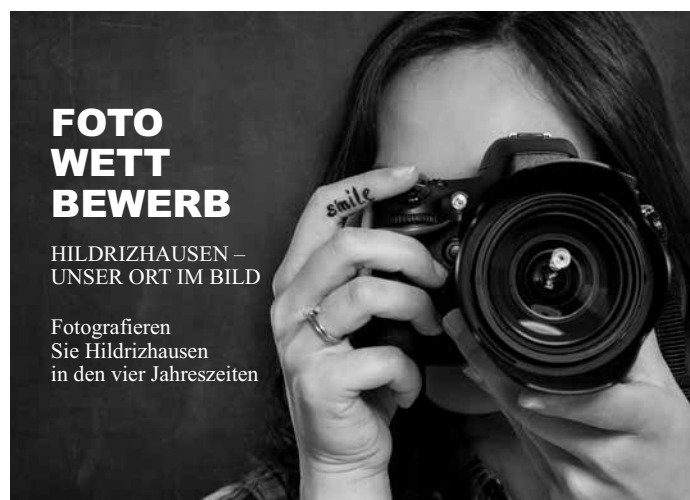
FOTO WETT BEWERB

Einsendeschluss ist am 30. Juni 2020. Viel Spaß beim Fotografieren. Wir freuen uns auf Ihre Bilder!