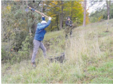
Mit Hacken und Spaten gingen die NABU-Aktiven ans Werk.

Viele Bereiche der „Greutäcker“ zeigten sich dank der jährlichen Pflegeaktion und der sommerlichen Beweidung bereits in sehr gutem Zustand.