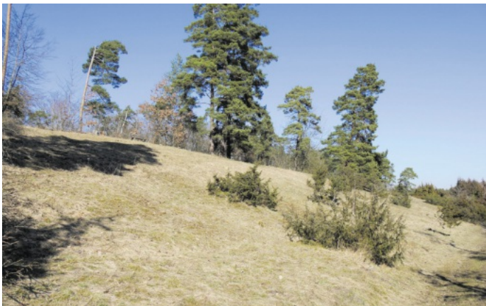
Halbtrockenrasen mit einzelnen Wacholderbüschen.

Am Samstag, dem 25. Oktober 2025, wird die ökologisch hochwertige, mit einzelnen Wacholderbüschen bestandene Magerrasen-Fläche durch Mahd mit Freischneidern und mechanischem Beseitigen von Gehölzaufwuchs bearbeitet, um diese von Gehölzen offenzuhalten. Nachdem die Fläche im Jahresverlauf durch Schafe abgeweidet wurde, stehen jetzt die Nacharbeiten als Vorbereitung für die kommende Blütensaison auf dem Plan. Auch die Reinigung mehrerer Nistkästen, die Vögeln, Fledermäusen und Hornissen eine Nistmöglichkeit bieten, steht ebenfalls an. Die Maßnahme führen wir wieder in Kooperation mit dem Schwarzwaldverein Gärtringen durch.