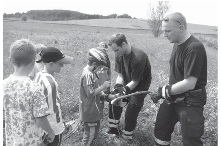
Übung mit hydraulischem Rettungsgerät

Nach einer kurzen Einteilung in 3 Gruppen ging es um die Themen „technische Hilfeleistung“, „Brandbekämpfung“ und „Sprechfunk“. Bei herrlichem Wetter genossen sowohl die Betreuer als auch die Kinder den wunderschönen Nachmittag.