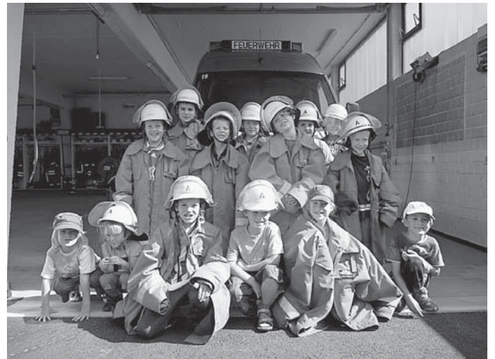
Gruppe mit Einsatzkleidung vor dem Feuerwehrgerätehaus

Nach der Verabschiedung im Gerätehaus gab es noch was zum Basteln und Malen als Abschiedsgeschenk.