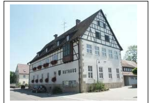
Altes Schulhaus, heute Rathaus